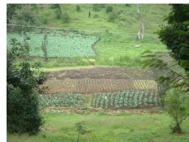
Landbouw project Tanzania