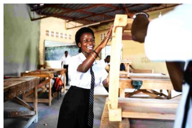
Materialen voor school