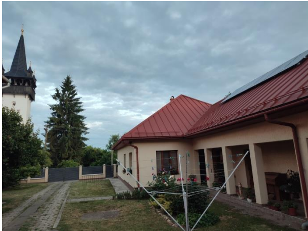
Gebouw in Bene met de zonnepanelen

Bijna een jaar geleden konden wij, met steun van de OSA, in het Oekraïense Bene (Transkarpatië) zonnepanelen en enkele batterijen installeren. Op 28 april 2025 werd de installatie officieel in gebruik genomen.