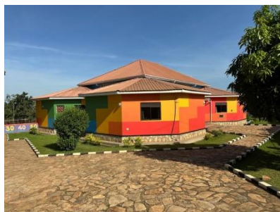
Renovatie dak kleuterschool