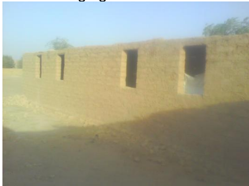
school in aanbouw