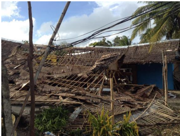
Na de tyfoon

De week na de tyfoon zijn we heel hard aan de slag gegaan en hebben we gedaan wat we konden. We hebben water en voedsel gebracht en helpen opruimen, bouwen en herstellen.